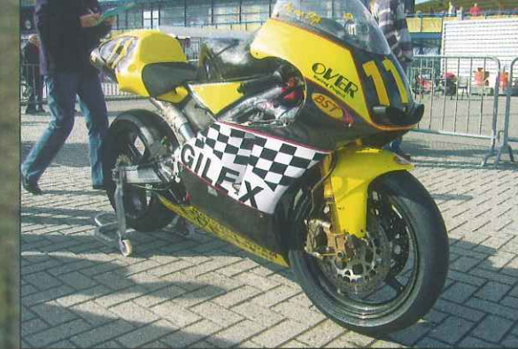
Over Yamaha Supermono in Assen