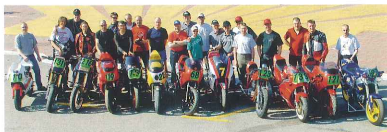
2007 war es, als alles begann. Am Rheinring trafen sich die Cup-Fahrer zum Auftakt-Training vor der ersten Saison

Nach den spannenden Anfängen wird seit 2009 in zwei unterschiedlichen Klassen gefahren, um die grundverschiedenen Ansprüche der Einzylinderfans befriedigen zu können: „Supermono“ und „Classic Monos und Twins“. In der Supermono-Klasse darf man mit jedem Einzylinder-Motorrad bis 800 ccm starten. Meist sind dies „Prototypen“, selbst gebaute Einzylinder-Renner. Derzeit stark im Kommen sind die so genannten Mini-Monos mit einem 400- oder 450-Kubikzentimeter-Motor, zum Beispiel aus einem Crosser, der in ein 125er-Fahrwerk gehängt wird. Solche Maschinen sind schnell, leicht und nicht zu teuer. „Wir bieten preiswerten Rennsport“, sagt Stiewe. Bei den Supermonos fahren die eher ambitionierten Fahrer. In der Classic Mono-