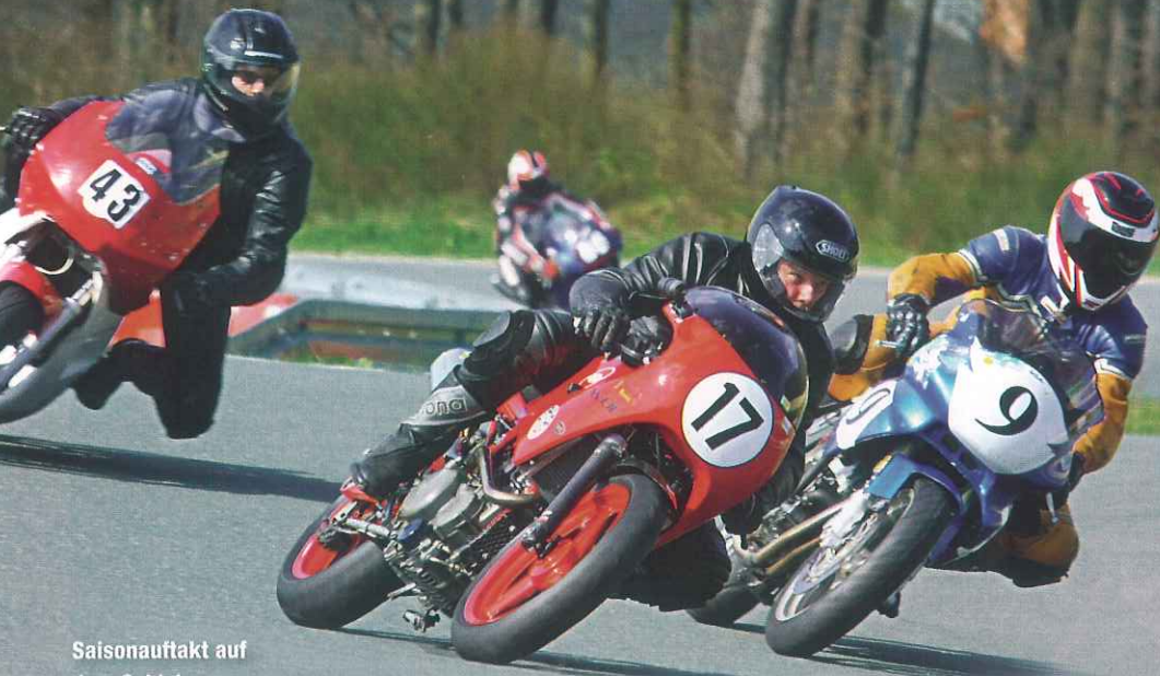
Saisonauftritt auf dem Schleizer Dreieck 2008

Erstausnlich inhomogen ist die Motorrad-Szene. Und im besten Sinne treibt dieser Zustand immer wieder ganz eigene Blüten. Eine davon heißt GSA, eine Einzylindergemeinschaft, die Gas gibt