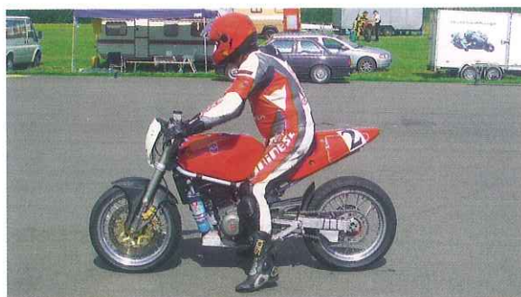
Gilera Saturno: Mit ihr lässt sich je nach Aufwand bei den Supermonos oder – stressfreier – bei den Classics mitfahren

viele andere. Dazu ein Fahrerlager, von dem einer sagt, dass es ein besonderes sei. „Das Gemeinschaftsgefühl wird von Achtung und Respekt getragen.“ Und wahrscheinlich auch